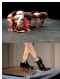
© Patrick Ernaux / Christophe Péan

Une soirée, deux spectacles ! D'abord « Une », un solo de claquettes qui entraîne le spectateur dans un tourbillon sonore et audacieux. Puis « Forum », où la danse contemporaine explore et interroge l'art de communiquer, des forums romains aux interactions sociales d'aujourd'hui.