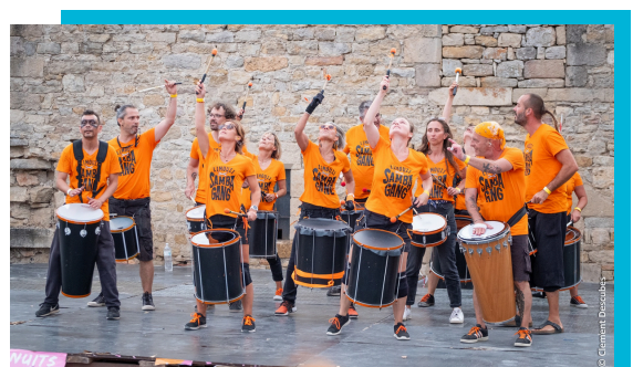
LIMOUZI SAMBA GANG