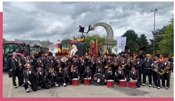
LES GUEULES SÈCHES