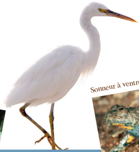
Agrion de mercure

Avec d'autres partenaires locaux, il participe à la régulation des espèces envahissantes et à l'amélioration de la qualité de l'eau. Enfin, il coordonne les actions mises en œuvre sur le site en partenariat avec le Syndicat mixte Vienne Gorre.