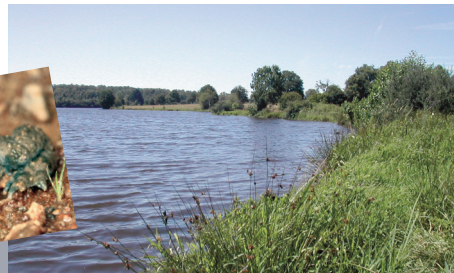
Cariçaie sur étang