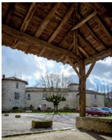
La halle de Mortemart.

Le Département a cofinancé sur les 3 dernières années plus de 3 000 projets de communes et communautés de communes, pour la rénovation de centres-bourgs, la sauvegarde du patrimoine, l'assainissement, l'aménagement d'espaces socio-culturels, sportifs et de bâtiments communaux ou encore pour le maintien des commerces et services de proximité. Par ces investissements, il agit en faveur du développement de la Haute-Vienne et de son dynamisme économique. En effet, les travaux menés contribuent à remplir les carnets de commande du BTP et à soutenir l'emploi local. Ils participent en outre à l'amélioration de votre cadre de vie.