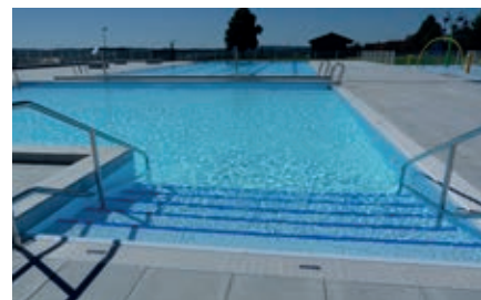
La nouvelle piscine d'Isle a ouvert ses portes cet été.