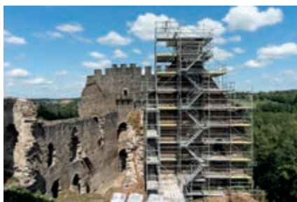
Des travaux pour allonger le circuit de visite.