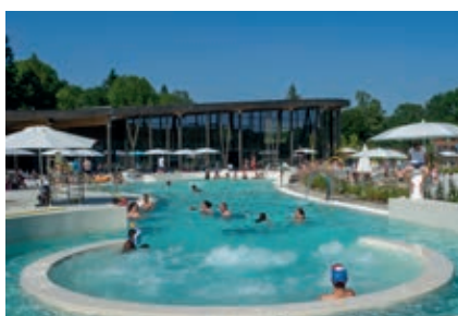
La piscine du lac de Saint-Pardoux.

Le lac de Saint-Pardoux constitue l'un des sites touristiques majeurs de la Haute-Vienne. Il a bénéficié ces dernières années d'un vaste programme d'équipement. L'ouverture de la piscine et toboggans extérieurs a largement stimulé la fréquentation du lac : 350 000 personnes s'y sont rendues cet été, comme en 2017. L'été dernier, c'est une piste cyclable reliant Santrop à Chabannes qui a été aménagée , pour un montant de 600 000 €. Elle est connectée à la liaison véloroute ouverte concomitamment entre le lac de Saint-Pardoux et le lac d'Uzurat à Limoges. Ce nouvel itinéraire propose une trentaine de kilomètres aux cyclotouristes ou amateurs de balades.