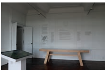
L'une des nouvelles salles sur l'histoire du château.

À Rochechouart , le Conseil départemental a achevé la restauration du château. Un chantier colossal lancé en 2015, qui a permis la rénovation de l'ensemble des façades et toitures, pour un montant de 3,6 M€. Par ailleurs, 2 salles retraçant l'histoire de ce château Renaissance ont été ouvertes à l'été 2017. Coût de l'extension : 220 000 €.