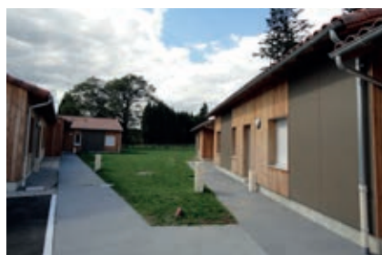
Logements adaptés à Saint-Pardoux

À l'horizon 2030, un tiers de la population haut-viennoise sera âgé de plus de 60 ans. Les besoins en termes d'accueil et de maintien à domicile des personnes âgées et/ou handicapées vont donc s'accroître. Face à ce défi, le Département agit sur deux fronts : la construction de logements adaptés en zone rurale et l'ouverture de lits en Ehpad.