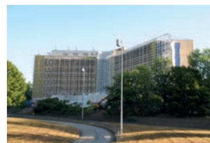
Les archives départementales.

Le lac de Saint-Pardoux constitue l'un des sites touristiques majeurs de la Haute-Vienne. Il a bénéficié ces dernières années d'un vaste programme d'équipement. L'ouverture de la piscine et toboggans extérieurs a largement stimulé la fréquentation du lac : 350 000 personnes s'y sont rendues cet été, comme en 2017. L'été dernier, c'est une piste cyclable reliant Santrop à Chabannes qui a été aménagée , pour un montant de 600 000 €. Elle est connectée à la liaison véloroute ouverte concomitamment entre le lac de Saint-Pardoux et le lac d'Uzurat à Limoges. Ce nouvel itinéraire propose une trentaine de kilomètres aux cyclotouristes ou amateurs de balades.