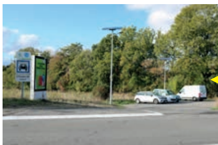
Aire de covoiturage de Lanaud le long de l'A20.

Restauration de la halle datant du XVII e siècle, aménagement de la place Royale, de la place du château des Ducs et dernièrement de la place des Carmes... La physionomie du centre-bourg de Mortemart, classé depuis 2011 parmi Les plus beaux villages de France, a bien changé ! Plus de 180 000€ de financements départementaux ont été alloués à cette opération.