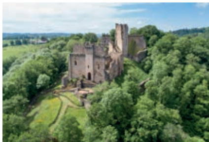
Châluset a attiré plus de 22500 visiteurs cet été.