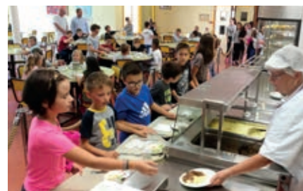
Agrilocal87 a facilité l'arrivée des produits locaux dans les cantines.