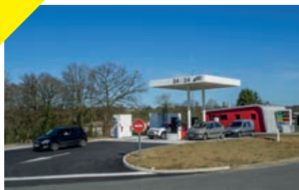
La station-service communale de Saint-Laurent-sur-Gorre.