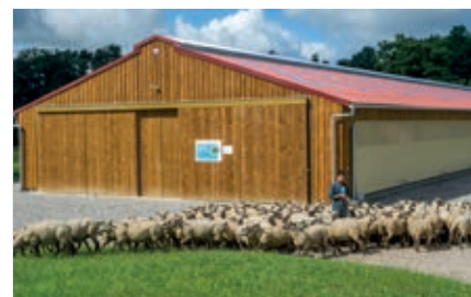
Le Département soutient les investissements des agriculteurs.

Afin d'encourager l'utilisation de denrées locales dans la restauration collective, le Département a lancé Agrilocal87 en 2016 . Aujourd'hui, plus de 100 fournisseurs sont connectés à cette plateforme en ligne et vendent de la viande, des fruits, légumes, fromages, yaourts, huile (tournesol, colza), poisson frais ou fumé, pâtes fraîches, pain de campagne... En 2017, 47 tonnes de produits ont été écoulés sur Agrilocal87, générant un chiffre d'affaires de 176 000 € pour les agriculteurs. •