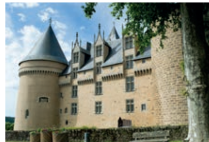
Les façades rénovées du château de Rochechouart.